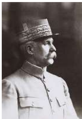
Pétain tijdens de Eerste Wereldoorlog

In mei 1917 werd Pétain benoemd tot opperbevelhebber van de Franse legers. Hij verving daarmee Nivelle, die verantwoordelijk was voor het mislukte offensief aan de Chemin des