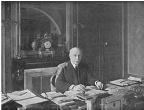
Pétain in zijn bureau in Vichy

Voor alles werd de liefde voor het Franse vaderland gepredikt. Daarbij moest worden afgerekend met 'anti-Frankrijk' en alles wat Frankrijk in het verderf had gebracht: joden , vreemdelingen, vrijmetselaars , communisten . Al meteen kwamen er uitgesproken xenofobe maatregelen. Amper tien dagen nadat hij staatshoofd was geworden vaardigde hij een wet uit waardoor alle Franse naturalisaties sinds 1927 moesten worden herzien. Op die wijze zouden 15.000 genaturaliseerde Fransen, onder wie 6000 joden, onder Pétains regering hun nationaliteit verliezen. Andere wetten beperkten overheidsambten en sommige andere beroepen tot Franse burgers die een Franse vader hadden. Een 'wet op de geheime verenigingen' verbood de vrijmetselarij en organisaties die geacht werden eraan verwant te zijn, zoals de Rotary Club en de theosofie . Pétain had een persoonlijke afkeer van vrijmetselaars, die hij ervan verdacht hem in zijn carrière te hebben tegengewerkt. Dat nam niet weg dat vooraanstaande vrijmetselaars, zoals oud-premier Camille Chautemps , zijn regime steunden.